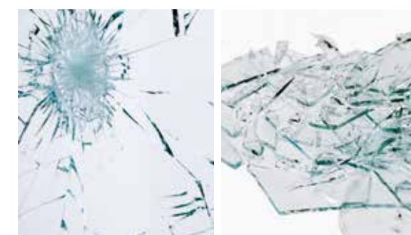
Das Verbundsicherheitsglas bricht trotz Gewalteinwirkung nicht auseinander. Gewöhnliches Fensterglas zersplittert und der Weg durch das Fenster ist frei.

Während normales Glas bei Gewalteinwirkung kaum Widerstand leistet, lässt das eingebaute Verbund-sicherheitsglas (VSG) Dieben die Lust am Einbrechen vergehen. Reißfeste Folien verhindern das Splintern der Scheibe, so bleibt die Öffnung verschlossen und die Verletzungsgefahr ist gebannt. Das Einscheibensicherheitsglas (ESG) weist durch die spezielle Wärmebehandlung eine erhöhte Stoß- und Schlagfestigkeit auf und ist somit auch unempfindlich gegenüber großen Temperaturunterschieden.